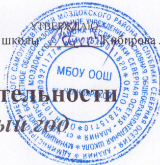
График внеурочной деятельности на 2023 -2024 учебный год