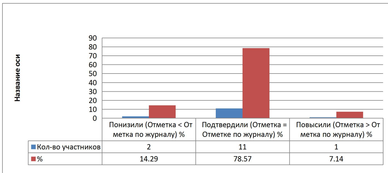
Диаграмма 2 показывает, что 14,29 % учащихся понизили результаты, 78,57 % подтвердили, 7,14% повысили свои результаты. Таким образом, сравнение результатов ВПР и школьной успеваемости по русскому языку учащихся 6 класса (за курс 5 класса) позволяет сделать вывод: