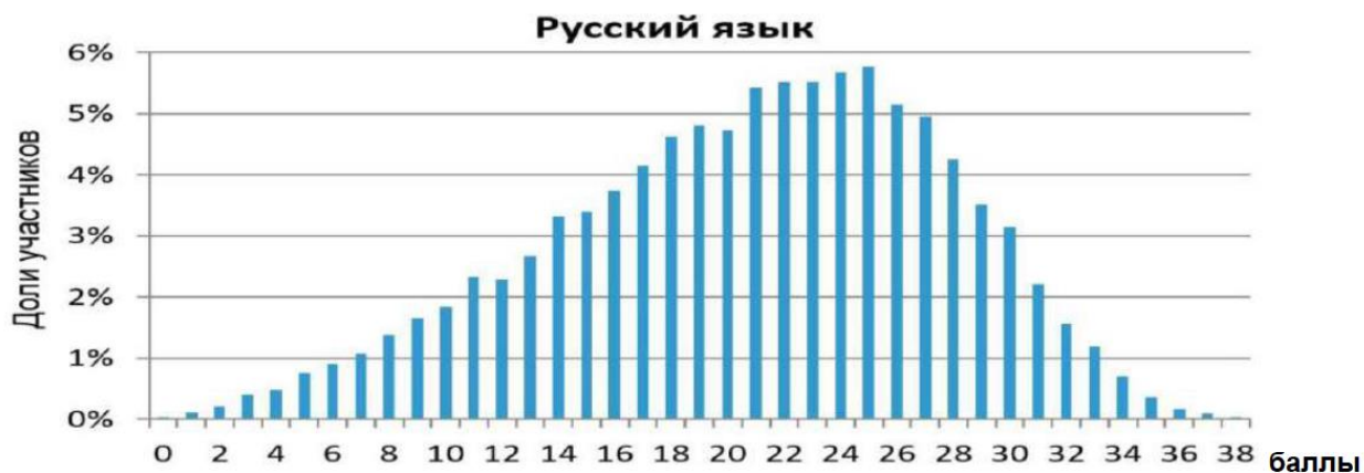
Рисунок 1. Распределение первичных баллов близкое к нормальному.

На рисунках 2 и 3 показаны примеры гистограмм, отклоняющихся от вида нормального распределения.